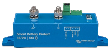
Smart BatteryProtect BP-100