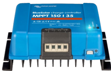
Solar Lade-Regler MPPT 150/35