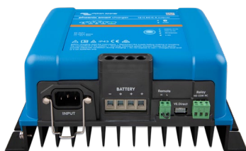
Phoenix Smart 12/50(3)