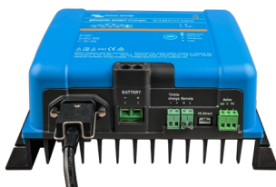
Phoenix Smart 12/50(1+1)